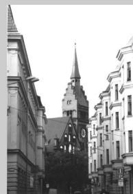
ukázka z připravované výstavy

uvidíte město Ostravu, její dominanty i tichá zákoutí, uvidíte místa nebo objekty, kterých si při rušném provozu ani nepovšimnete.